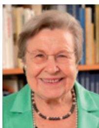
Prof. Dr. Ursula Lehr Ehrevorsitzende der BAGSO

Wir möchten mit diesem Ratgeber einen Beitrag zur Prävention leisten und es insbesondere älteren Menschen leichter machen, Hilfe in Anspruch zu nehmen.